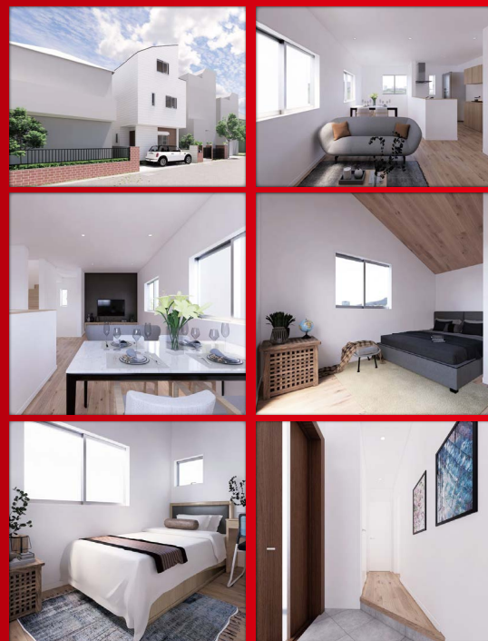
※建物プラン イメージパース