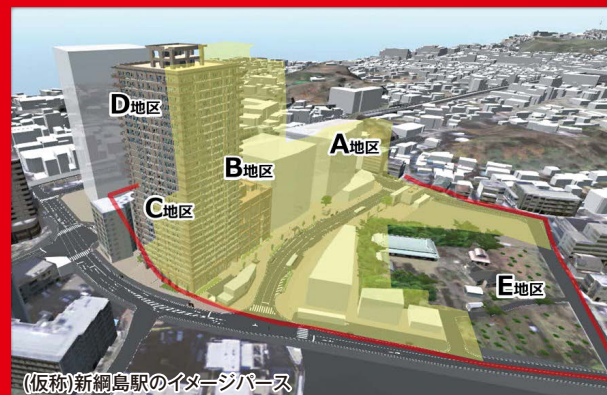
(仮称)新綱島駅のイメージパース