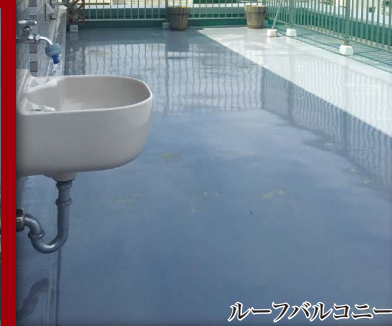
ルーフバルコニー